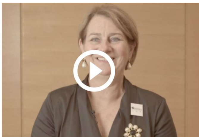
Tone Wilhelmsen Trøen, Ex-présidente du Parlement/Storting, Norvège