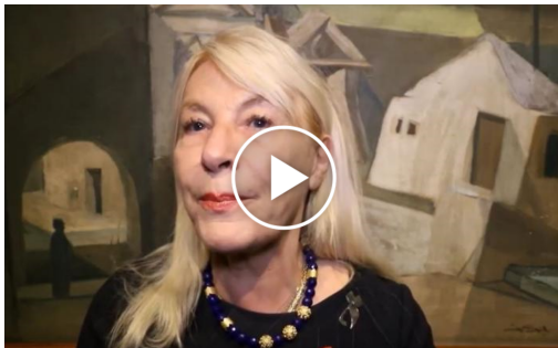
Nicole Ameline Vice-présidente du Comité CEDAW (NU) France