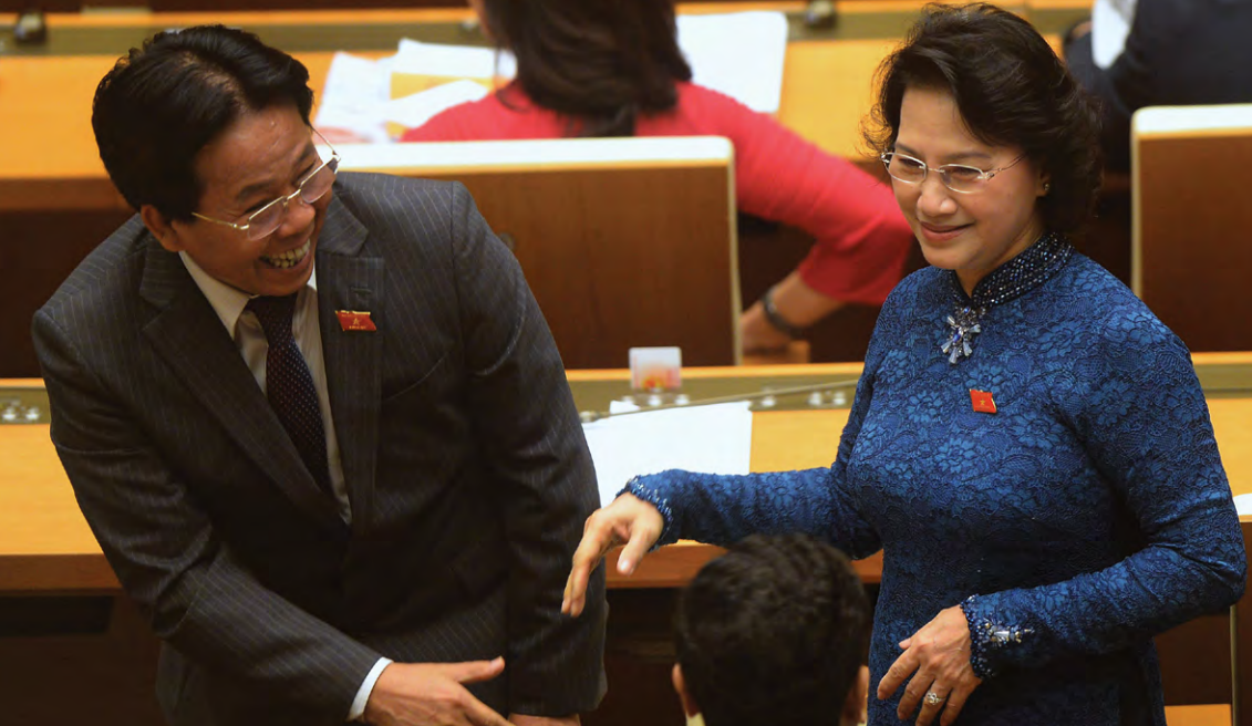
La première Présidente de l'Assemblée nationale du Viet Nam, Nguyen Thi Kim Ngan, lors de la cérémonie d'ouverture de la nouvelle session du parlement.