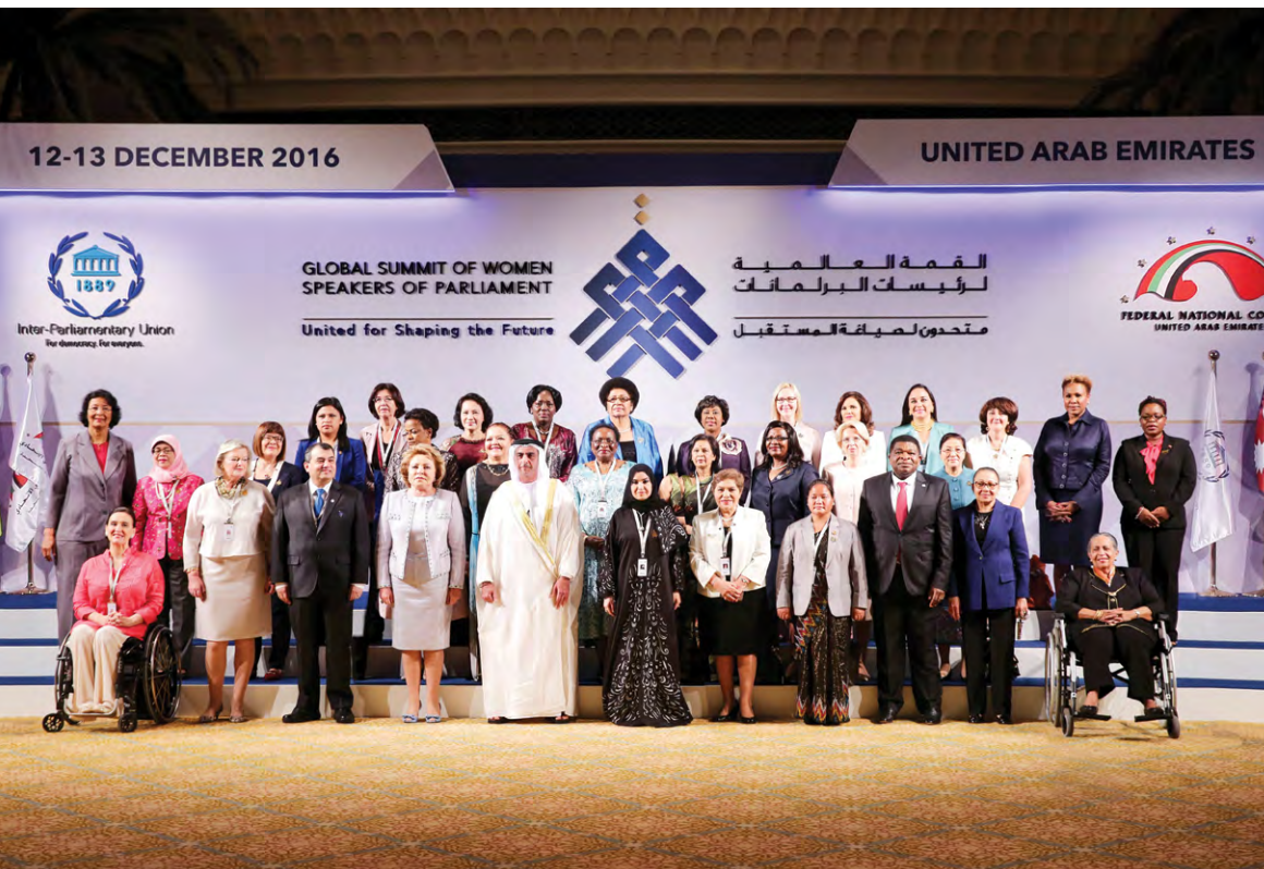
34 Présidentes de parlement se sont rassemblées à Abou Dhabi pour un sommet mondial sur des enjeux internationaux.