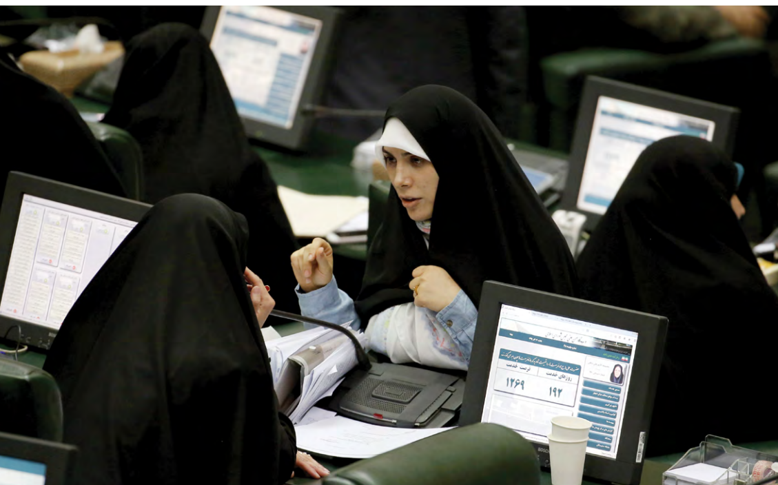
Des femmes parlementaires iraniennes dialoguent au sujet d'une proposition de budget annuel durant une session parlementaire, en décembre 2016.

Au Japon, il y a eu des élections à la chambre haute (Chambre des Conseillers) en juillet 2016. Le nombre de femmes élues a atteint le chiffre record de 28. Ces résultats portent le nombre total des femmes à 50 sur les 242 membres de cette chambre (soit 20,7 % contre 16,1 % aux élections précédentes). Cette proportion est bien supérieure à celle observée à la chambre basse qui ne comptait que 9,5 % de femmes après les élections de 2014. Plus tard dans l'année, le deuxième parti politique du Japon (le Parti démocrate, dans l'opposition) a élu une femme à sa tête. Au niveau local, une femme a été élue pour la première fois aux fonctions de Gouverneur de Tokyo en 2016. Au Japon, le combat des femmes pour l'inclusion politique ne se limite pas aux défis du système électoral (qui prévoit, entre autres, le versement par chaque candidat d'une somme équivalente à 30 000 dollars E.-U.). Les femmes doivent aussi se battre contre une société plutôt conservatrice, dans laquelle les rôles respectifs des deux sexes sont fortement enracinés.