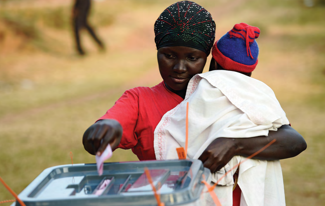
Une femme exerce son droit de vote à l'occasion des élections nationales en Ouganda, en février 2016.

insinuations à caractère sexuel jusqu'à la remise en question continuelle des droits des femmes, cette campagne est apparue comme la plus déplaisante de toute l'histoire électorale américaine. La défaite de Mme Clinton est révélatrice du défi que représente l'élection d'une femme au poste le plus convoité des Etats-Unis.