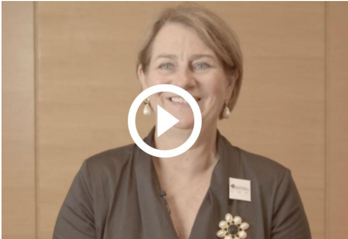
Tone Wilhelmsen Trøen, Ex-presidenta del Parlamento / Storting, Noruega