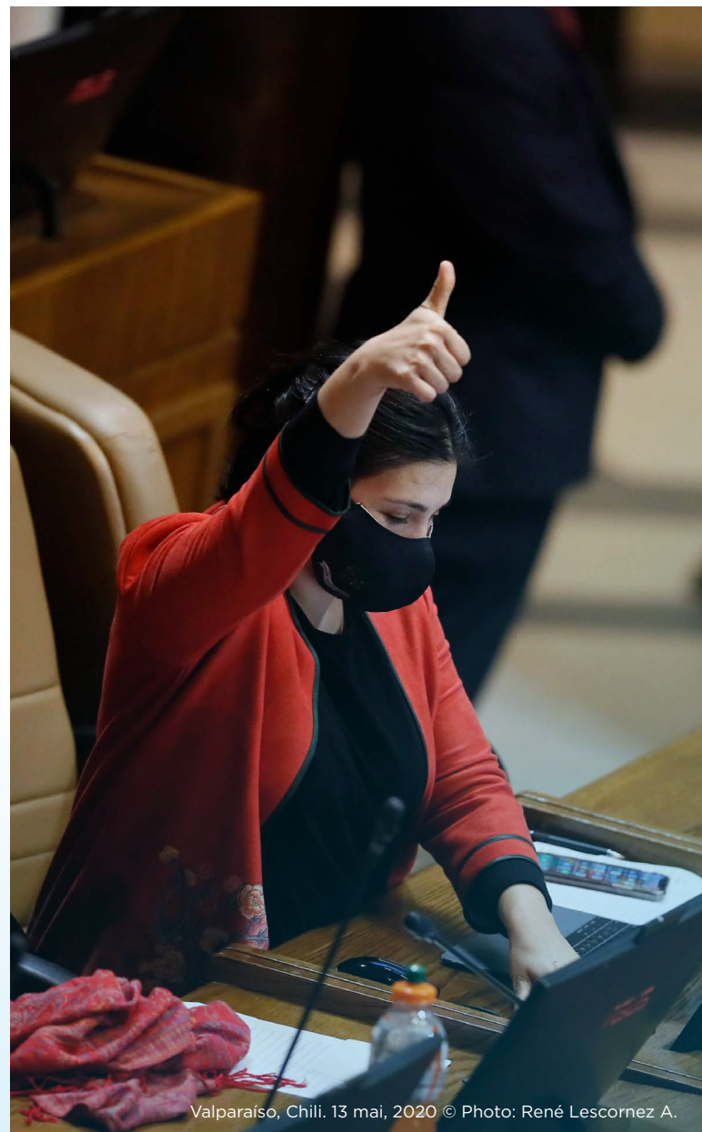
Valparaiso, Chili. 13 mai, 2020