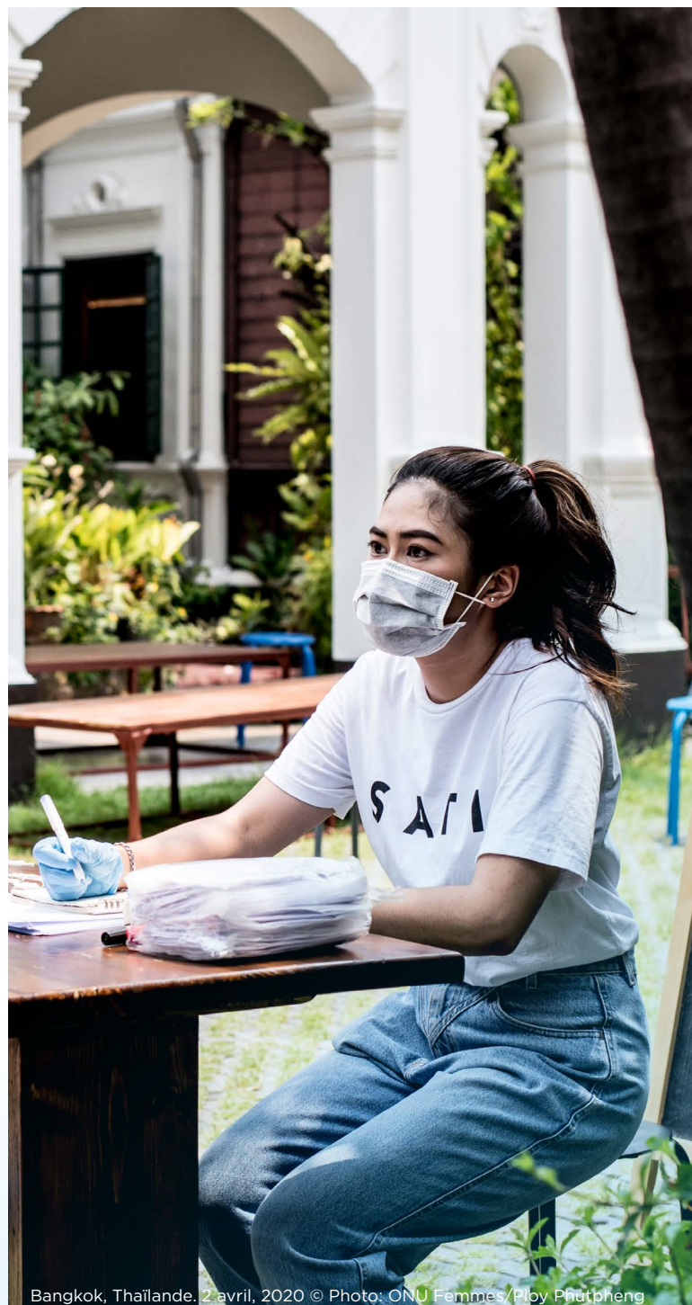
Bangkok, Thaïlande. 2 avril, 2020

Les parlements devraient saisir l'occasion offerte par la pandémie pour réfléchir sur la sensibilité au genre de leur réponse à la crise, et pour apporter des changements le cas échéant.