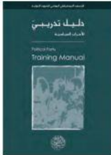
توظيف الإنترنت للاتصال و التنظيم